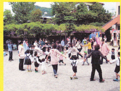
〈なべなべ そこぬけ♪〉