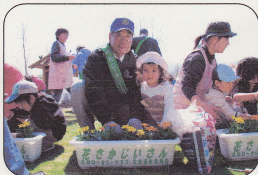
〈 一緒に植えようね 〉

* 植えた花は、石和温泉足湯ひろばなどに飾られ、地域だけでなく観光客の目をなごませました。