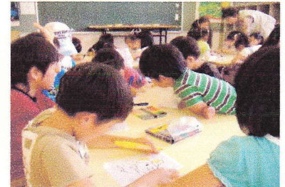
〈プラ板でキーホルダー作り〉