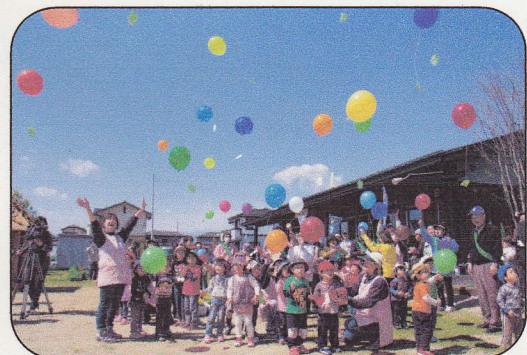
〈 一斉にとぼすよ！1・2のハイ！ 〉