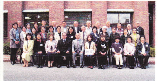
峡東教室 1年生のみなさん