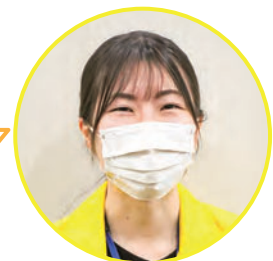
一宮地域事務所 大村

見守りネットワークは、社協がつなぎ役となり、事業所の皆さまからの通報を速やかに関係機関へつなげるとともに、その結果を事業所様へお返ししています。ご協力いただく事業所様のみならず、住民の皆様に安心していただける仕組みとなっています。見守りの目がふえていくことで住民の皆さまの安心につながっていきます。さらなる事業所の皆様のご協力をよろしくお願いいたします。