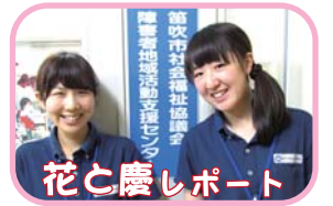
花と慶しレポート

分達で出来る事は自分達で行い、障がいがある仲間たちがお互いの障がいを理解し合い、助け合うことができた旅でした。